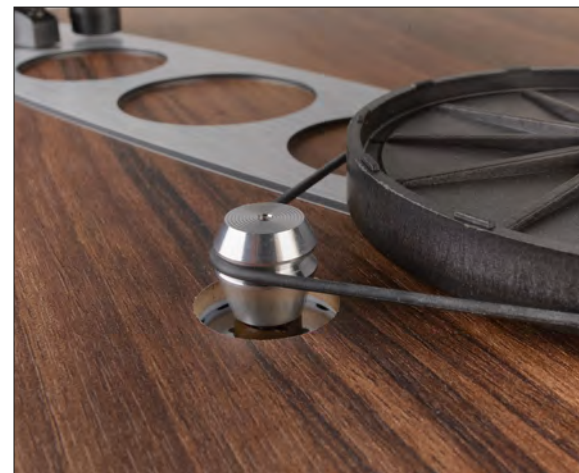
Motorpulley und Riemen stammen aus größeren Rega-Modellen

Wenn nur alles in der Analogwelt so einfach wäre wie die Inbetriebnahme eines Regas: Hinstellen, Steuer- und Netzteil einstecken, an eine MM-taugliche Phono-vorstufe anschließen – fertig. Und das Tolle ist, dass die akustische Belohnung sich bereits mit dem Auflegen der ersten Platte einstellt. Wieder einmal eine dieser Situationen, in der man sich fragt, ob der Aufwand, den man sonst rund um das Thema betreibt, eigentlich wirklich gerechtfertigt ist. Der Rega – er macht einfach. Im Plattenregal finde ich den fast ungespielten Steely Dan-Sampler „Gold“ – der kommt mir gerade recht: Der Einsteiger „Hey Nineteen“ swingt ungestüm drauf los. Dass Fagen und Becker das beherrschten wie kaum jemand anderes, beweist der Rega in Sekunden. Im Bass kompakt, pointiert und auf den Punkt. Nicht auffällig tief oder voluminös, sondern einfach passend. Sehr schön. Das Exact wirkt bereits jetzt erfreulich aufgeweckt und geschmeidig, es liefert den MM-typischen Zusammenhalt. Auch der „Deacon Blues“ klingt ausgesprochen fluffig und locker, das darf so bleiben. Rainbows unfassbar großartiges Live-Album „On Stage“ lege ich viel zu selten auf, wie ich mal wieder feststellen muss. Zu-