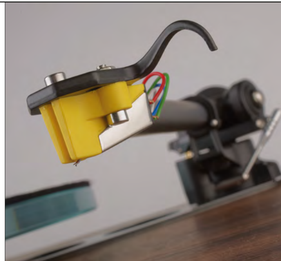
Das Exact erwies sich als feiner, flüssiger und absolut adäquater Spielpartner für den Jubi-P3

Den runden Geburtstag des Unternehmens mit einer ganz leicht anders abgeschme-