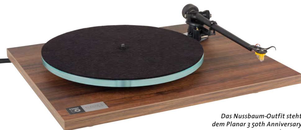
Das Nussbaum-Outfit steht dem Planar 3 50th Anniversary ausgesprochen gut

Wie beim Standard-P3 gibt's die auffällige „Brücke“ zwischen Tellerlager und Tonarmschaft, die für eine abermals möglichst leichte und steife Verbindung zwischen beiden Komponenten sorgen soll. Auf der Oberseite ist's ein großzügig gelochtes Aluminiumteil, auf der Unterseite ein Pendant aus Phenolharz. Das Gerät ruht auf drei Puffern aus relativ hartem Elastomer, die – natürlich – nicht in der Höhe verstellbar sind. Deshalb gilt wie bei allen Rega-Drehern: Für eine festen und ebenen Stand müssen Sie selbst sorgen.