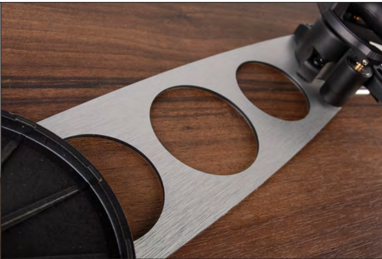
Die Metallbrücke verbindet Tellerlager und Tonarmschaft miteinander