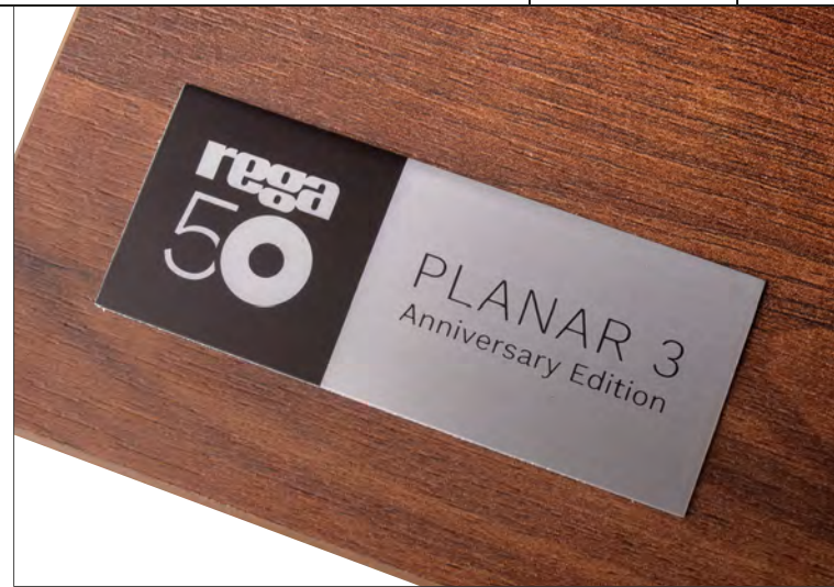
Ein halbes Jahrhundert Rega – das ist mal eine Leistung