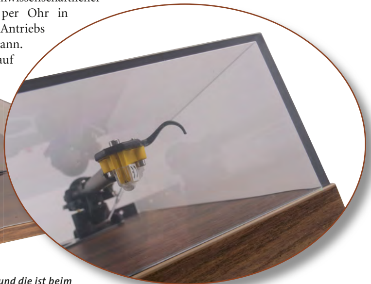
... und die ist beim Sondermodell dunkel getönt ausgefallen